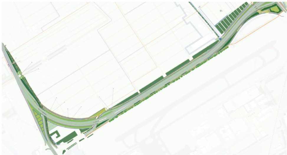
Het tracé van deelgebied West

Bij het westelijke deel van de weg is veel aandacht nodig voor de aansluitingen op de A13 en op de wegen en fietspaden bij Schieveen en het vliegveld. Vanaf de polder zal de weg zoveel mogelijk aan het zicht worden onttrokken. Een fietspad en enkele aansluitende wegen komen anders te liggen. De onderdoorgang tussen de Hofweg en de Tempelweg wordt sociaal veiliger gemaakt. De geluidbelasting van de omgeving neemt niet toe ten opzichte van de huidige situatie.