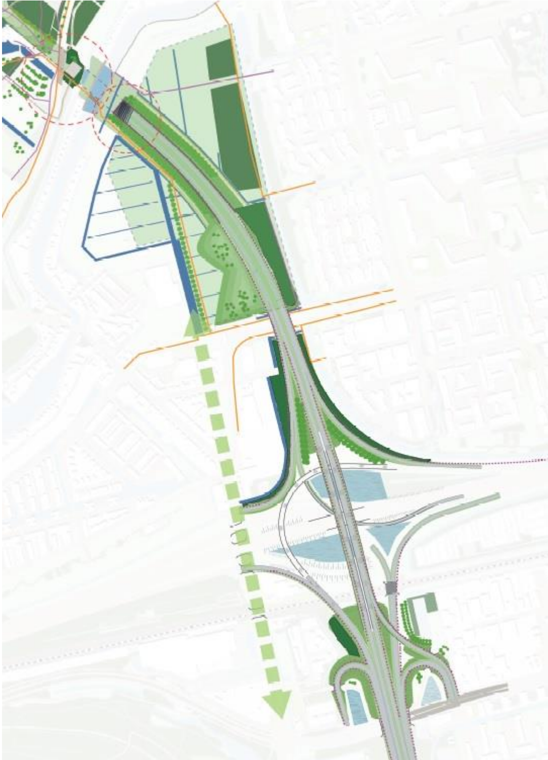
Oplossingenkaart, uitsnede Terbregseveld