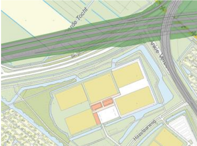
Ligging rijksweg t.o.v. huidige ligging N209