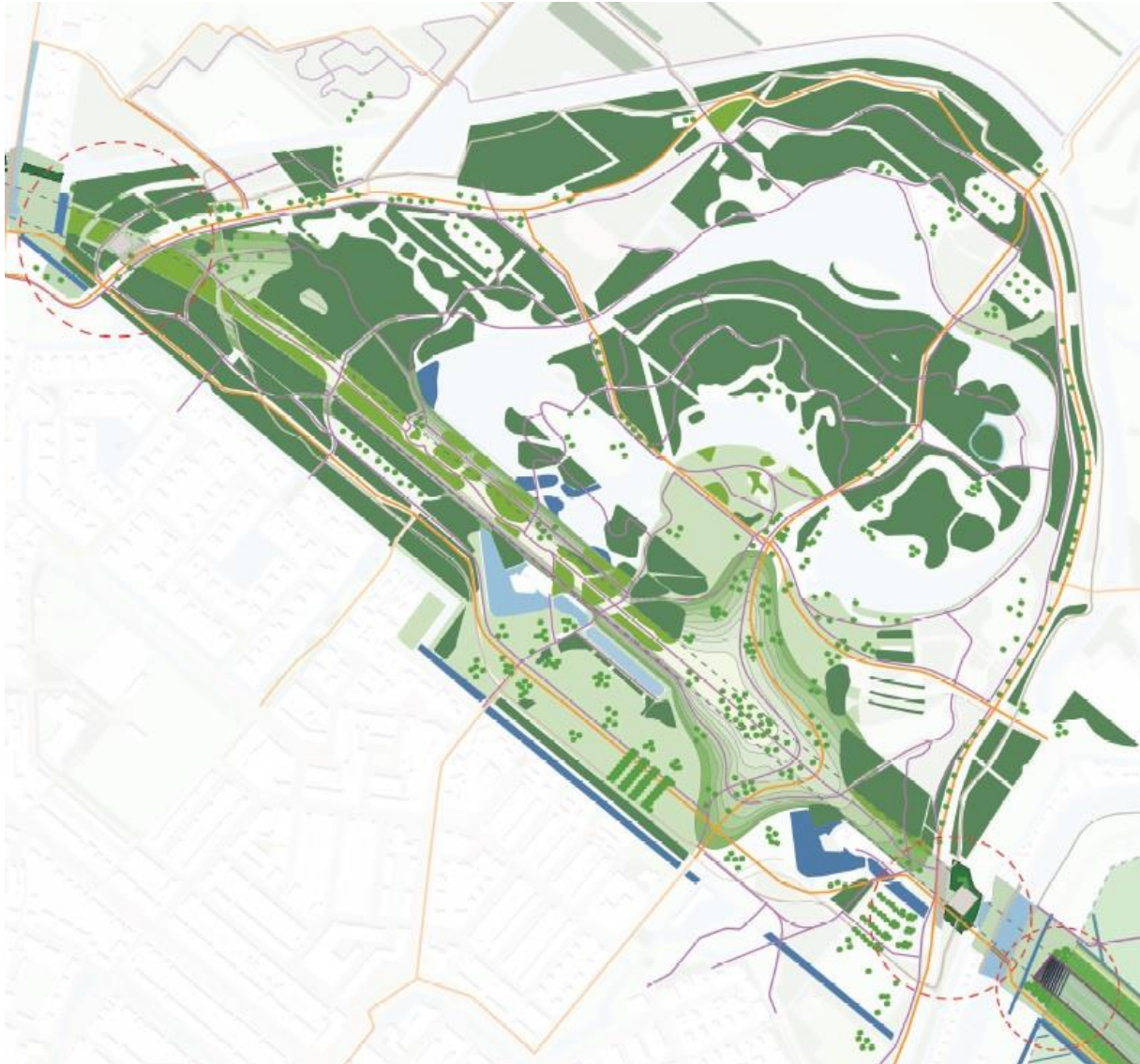
Oplossingenkaart, uitsnede Lage Bergse Bos

Het recreatiegebied Lage Bergse Bos (LBB) in de gemeente Lansingerland ligt tegen de bebouwde kom van het Molenlaankwartier in deelgemeente Hillegersberg-Schiebroek en is in 1970 aangelegd. Van oorsprong was het een weidegebied in een droogmakerij; een meer dat in de 18e eeuw is drooggemalen door molens. De polder ligt daarom erg laag ten opzichte van zijn omgeving, te weten 6 meter beneden NAP. Het recreatiegebied Lage Bergse Bos is ongeveer 160 hectare groot. Het gebied is ontworpen in Engelse Landschapsstijl.