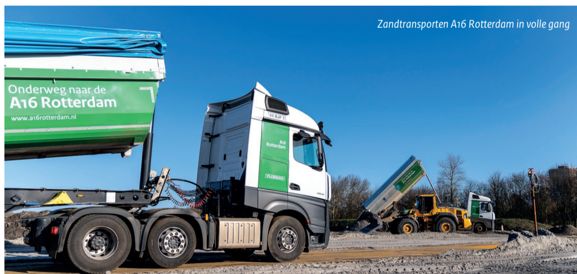
Zandtransporten A16 Rotterdam in volle gang