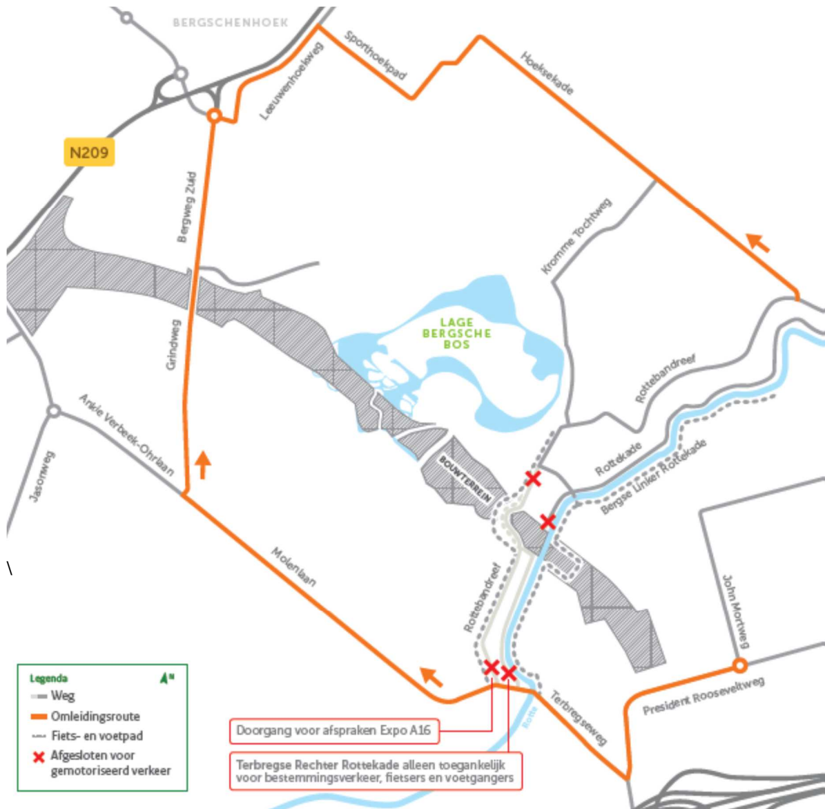
Afbeelding: omlidingsroute autoverkeer

Rotterdam en Lansingerland beter bereikbaar en leefbaar